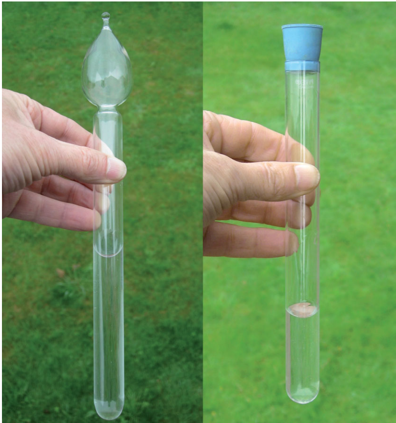
Abb. 1 Links: Wasserhammer als Designobjekt. Rechts: Einfacher Nachbau des Wasserhammers.

Wenn die Heizung wieder mal lärmt oder der Teekessel die Erwärmung des Wassers akustisch untermalt, haben wir es mit Effekten zu tun, deren physikalische Ursache sich nicht so ohne Weiteres erschließt. Eine interessante Verbindung zu diesen Vorgängen schafft das Kunstobjekt mit dem Namen Wasserhammer (Abbildung 1 links) [1].