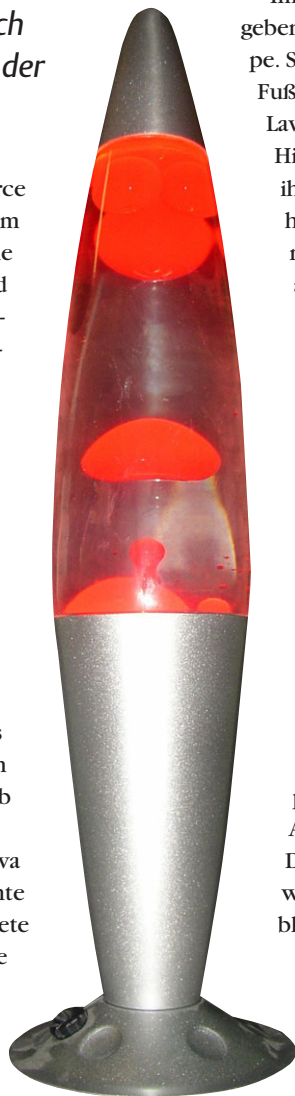
Abb. 1 Beispiel einer Lavalampe.

In Folge der permanenten Wärmeabgabe von auf- und absteigenden Lavatropfen an die Matrix steigt natürlich deren Temperatur. Befände sich die Matrix in einem ideal wärmeisolierten Behälter, würde sie sich im Langzeitbetrieb derart erwärmen, dass schließlich kein Temperaturunterschied mehr zwischen Lavatropfen und Matrixfluid vorhanden wäre. Dann würde die gesamte Lava aufsteigen, könnte sich nicht mehr an der Matrix abkühlen und der Prozess käme zum Erliegen.