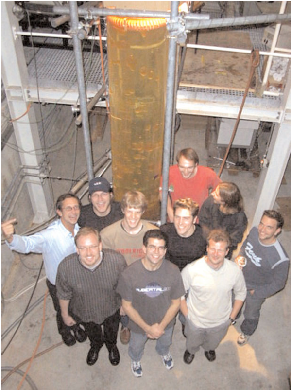
Abb. 3 Mitglieder der TU München vor ihrer Riesenlavalampe.

Der Bau einer 20 Meter hohen Riesenlavalampe würde weitere Untersuchungen erfordern, deren Kosten nur schwer abzuschätzen sind. Vielleicht bleibt die Idee auch ein Traum.